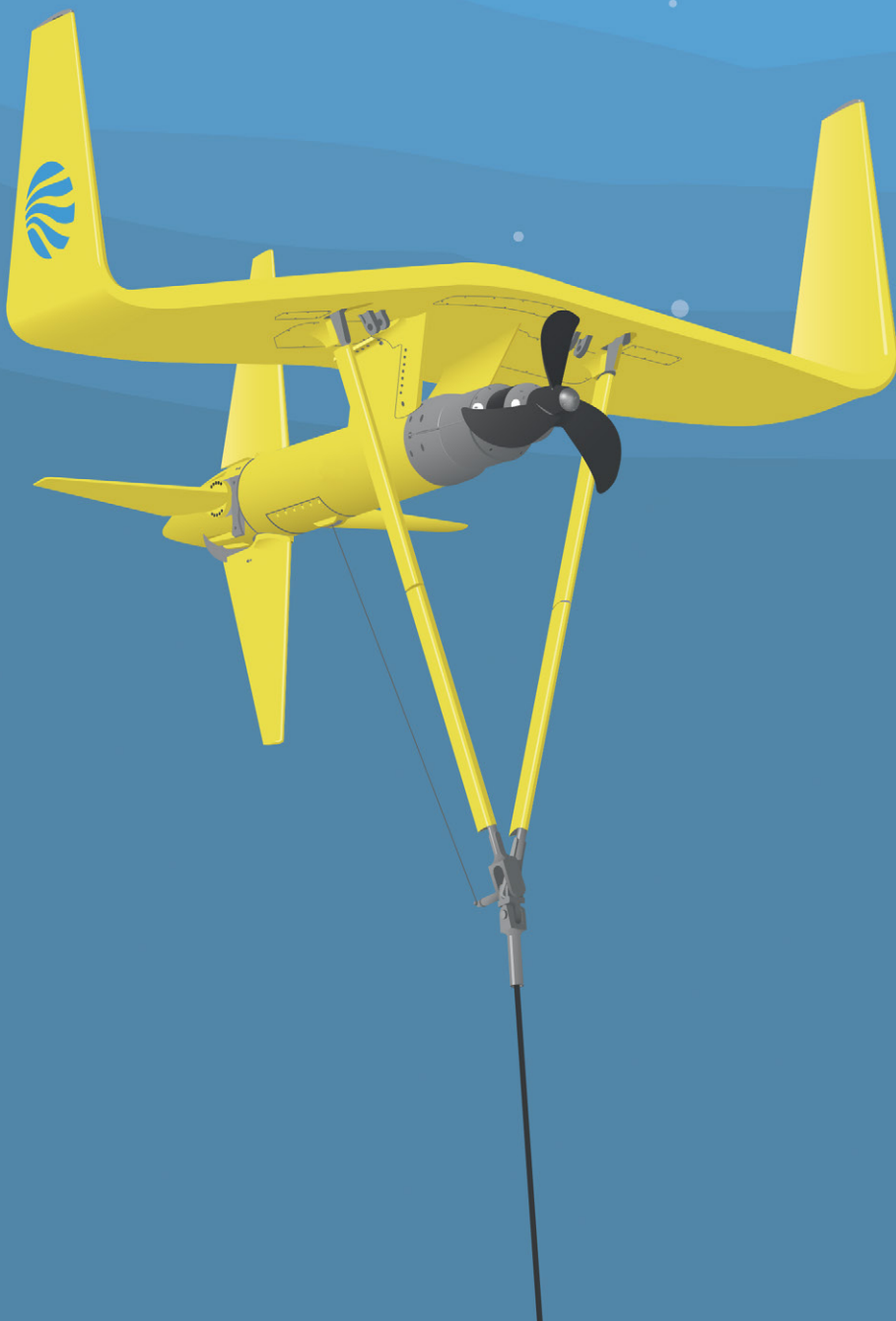
Illustration av Minestos marina kraftverk DG100.